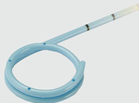
Catéter Multi-Loop Nonstone