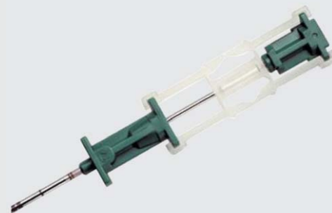
Exclusivo espaçador de agulha