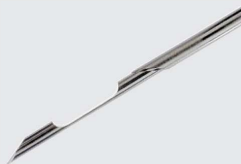
Gaveta de amostra de 8mm