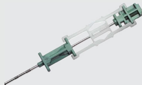
Exclusivo espaçador de agulha