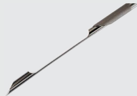
Gaveta de amostra de 17mm